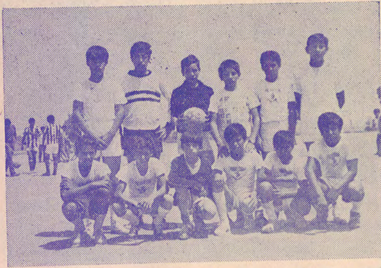
Integrantes del equipo de futbol de la Escuela Secundaria Federal Ignacio Ramírez, que el lunes pasado en un juego amistoso cayeron por 3 a 0 ante el equipo de la escuela de Acuescomac, su mérito fue grande al competir con muchachos de mayor edad y estatura. En el tiempo reglamentario terminaron empatados a dos goles y hubo necesidad de jugar tiempos extras perdiendo por el mínimo marcador.

Fue acusado en el Juzgado Menor de esta ciudad, Laure Garay Almaraz, de querer apropiarse de una marrana y su